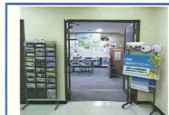
エレベーター開きましたら左折、突き通りに案内板がございます。左折しますと入口です。