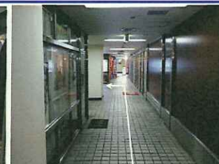
【6】ラーメン屋さん前のエレベーターで4階にお上がり下さい。