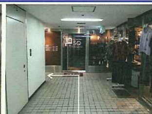
【5】すぐに突き当たるSCAL QU ICKさんを左折します