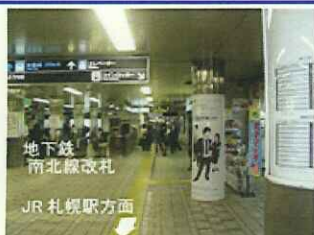
【1】地下鉄南北線北改札口までお越し下さい。