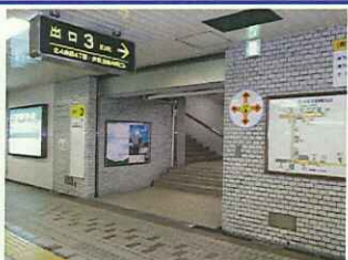
【2】北改札口すぐ横にある出口3番の階段をご利用下さい。