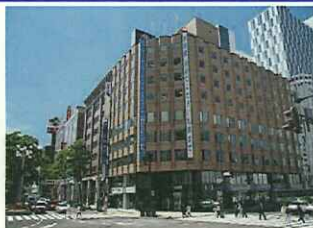
【1】札幌駅南口を背に見た伊藤・加藤ビル概観。