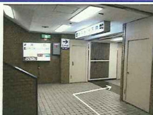
【4】すぐに突き当たりますので再度右折してください。