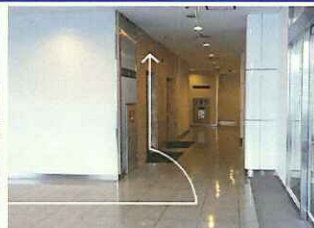
【3】中に入り奥のエレベーターで4階へお上がり下さい。