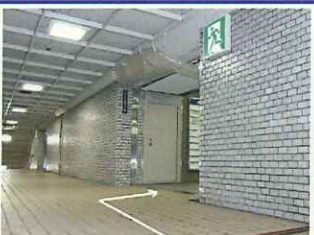
【3】上りきるとすぐに見える避難口誘導灯で右折します。